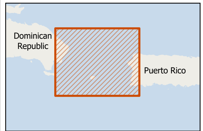
Project Area Map / Mapa del área del proyecto CTDC – Project Hostos